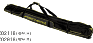
Z02118 (3PAIR) Z02918 (5PAIR) Z02818 (5PAIR/ホイール付)