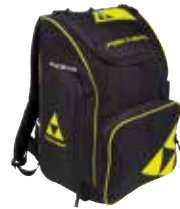
Z01318 / Z03518 / Z05218