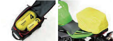
メイン気室収納例