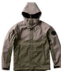
ストーンベージュ/オリーブ(SL)