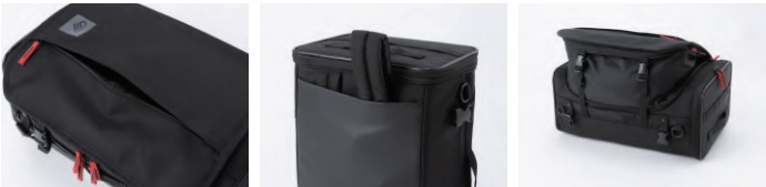
フラップ部ポケット