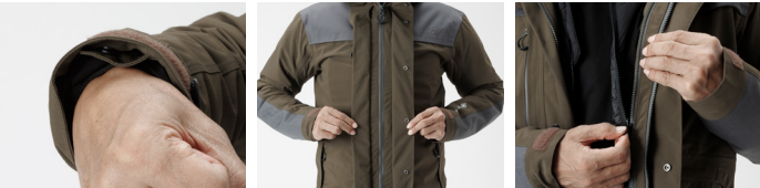
袖口エアインテーク