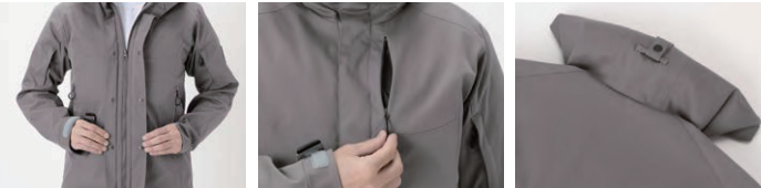
フロントダブルフラップ