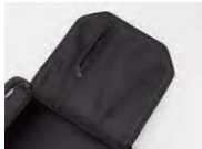
フラップ裏内ポケット