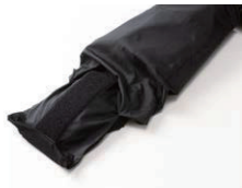
プロテクター位置調整機能