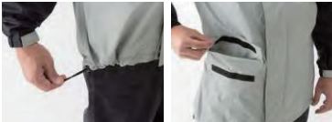
ジャケット裾ドローコード 右裾ポケット