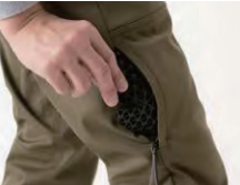
プロテクター着脱仕様