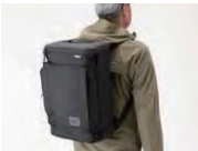
バックパック着用