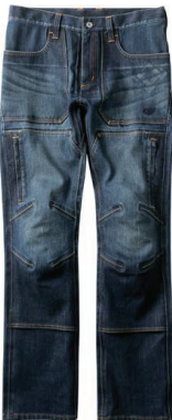
ハードウォッシュ(HW)