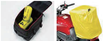
メイン気室収納例