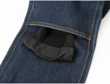
膝プロテクター位置調整機能