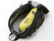
メイン気室収納例