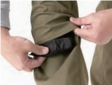
プロテクター位置調整機能