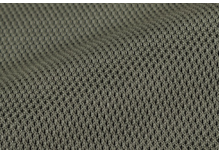
ポリエステルメッシュ