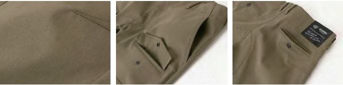
プライムフレックスツイル・サイトスGR