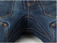
フロントファスナー内側防水マチ