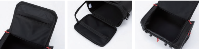
フラップ裏内ポケット