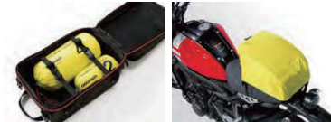
メイン気室収納例