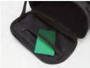
バックパック時上部開口部内ポケット