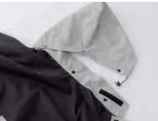
フードは着脱可能