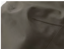
200Dナイロンオックス・ゴアテックス3L