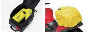
メイン気室収納例