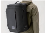
バックパック着用