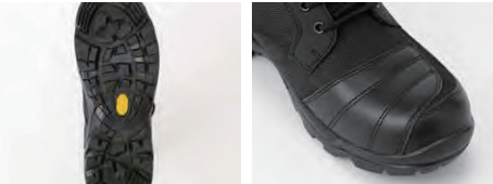
ヴィブラムソール(底面)