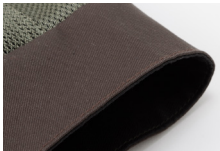
手首部プライムフレックスツイル