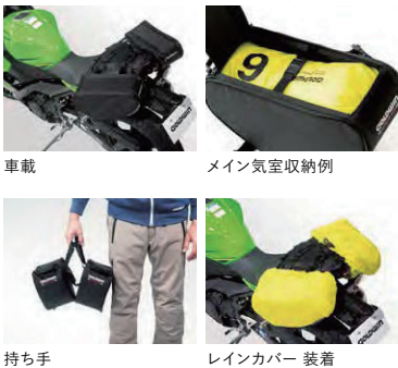
※小物類は付属しません