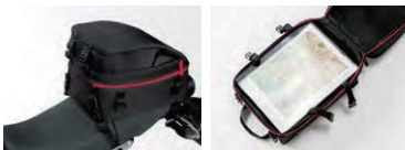
容量可変 最大使用時 前部