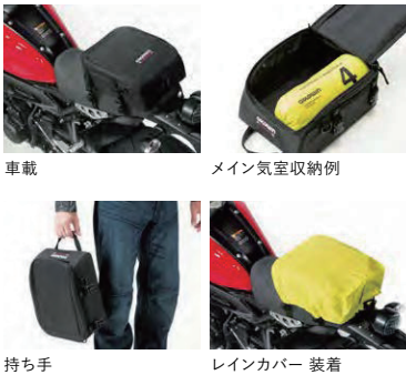
※小物類は付属しません