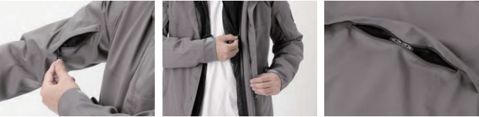
上腕エアインテーク