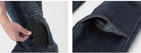
腿部膝プロテクター挿入口