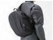
ショルダーベルト