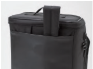
ショルダーベルト収納